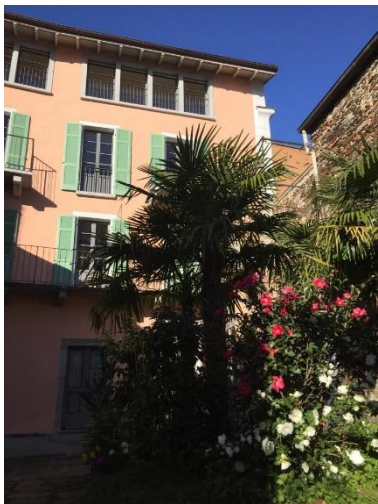
Innenhof der Casa Leoncavallo 21

Mit diesen Fragen hat sich Dr. Moshé Feldenkrais (1904- 1984, Kernphysiker, Ingenieur und begeisterter Sportler) auseinandergesetzt. Er hat festgestellt, dass Bewegung beim Lernprozess eine zentrale Rolle spielt. Beim erwachsenen Menschen ist es vor allem die bewusste Wahrnehmung von Bewegungsmustern und deren Differenzierung, die zu einer besseren Lernfähigkeit führen. Aus dieser Erkenntnis heraus hat Feldenkrais seine Methode entwickelt.