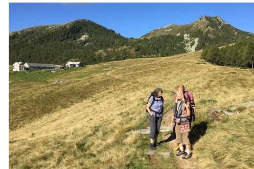
Von der Alpe Salei führt ein Plattenweg nach Alpe Arena zwischen dem Valle Onsernone und Valle Vergeletto.

Was immer möglich ist, sind Wanderungen auf die Monti di Brissago, ein kühles Bad im See oder ein Tagesausflug auf die Alpe Salei. Wo man mit oder ohne Wanderung einen wundervollen Tag verbringen kann.