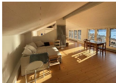
Gruppenraum im Dachgeschoss